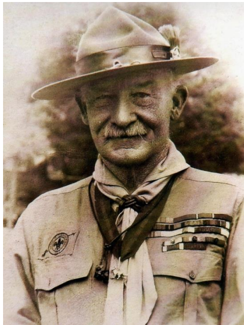
Robert Baden Powell

"Lo maravilloso de estos chicos es la alegría y su empeño por hacer todo lo posible en el Escultismo. No quieren pruebas o tratamientos especiales, salvo cuando ello sea absolutamente necesario"